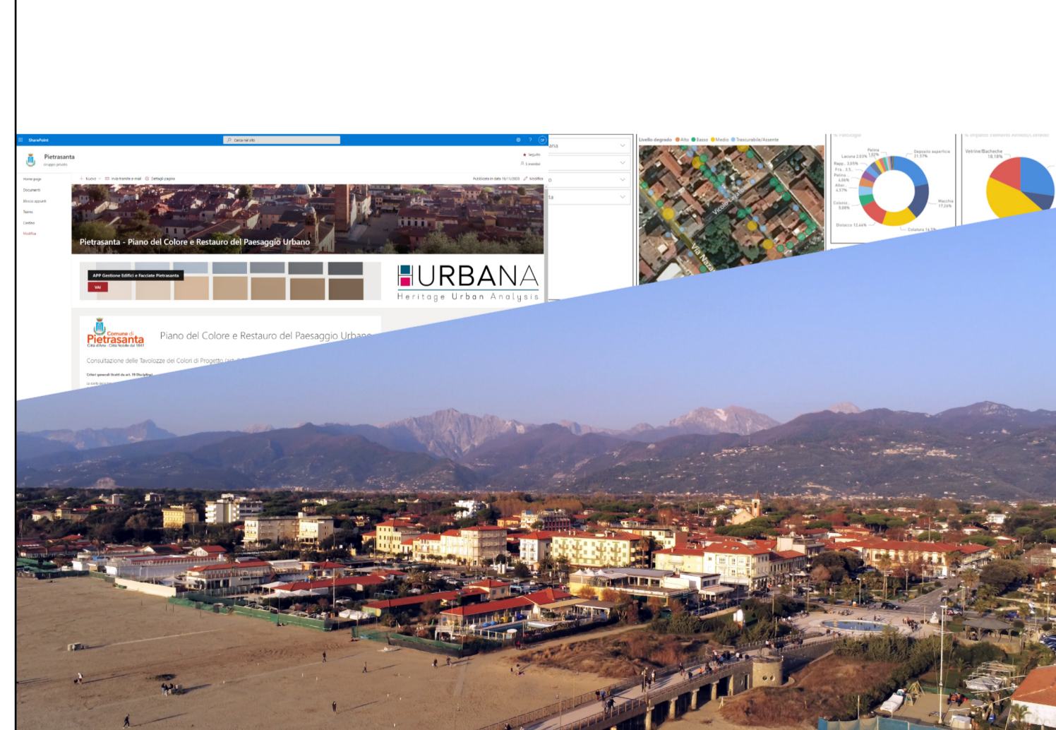
Piano del Colore e Restauro del Paesaggio Urbano

ELABORAZIONE Irene Centauro CONSULENTI David Fastelli - Giuseppe Alberto Centauro