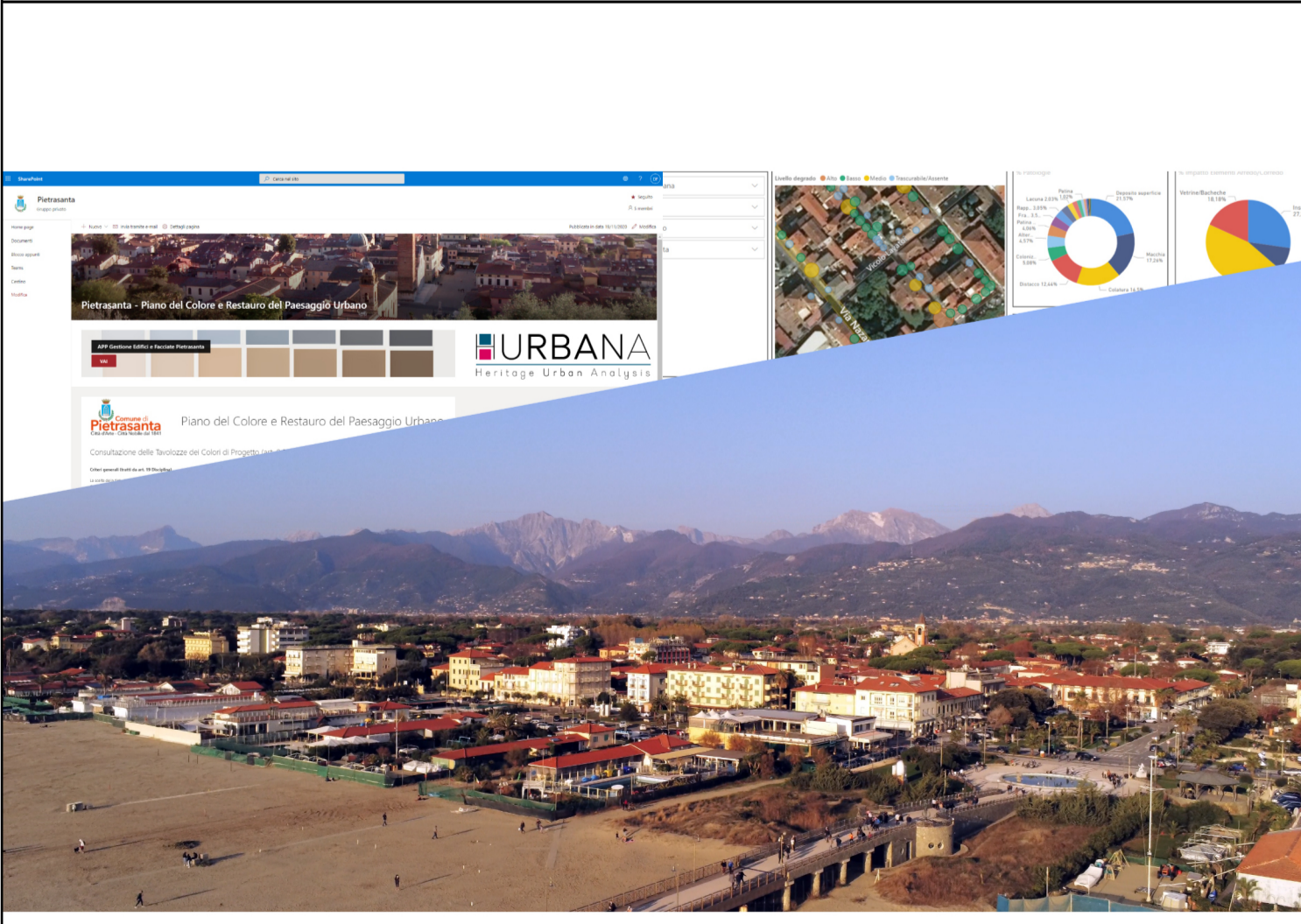
Piano del Colore e Restauro del Paesaggio Urbano