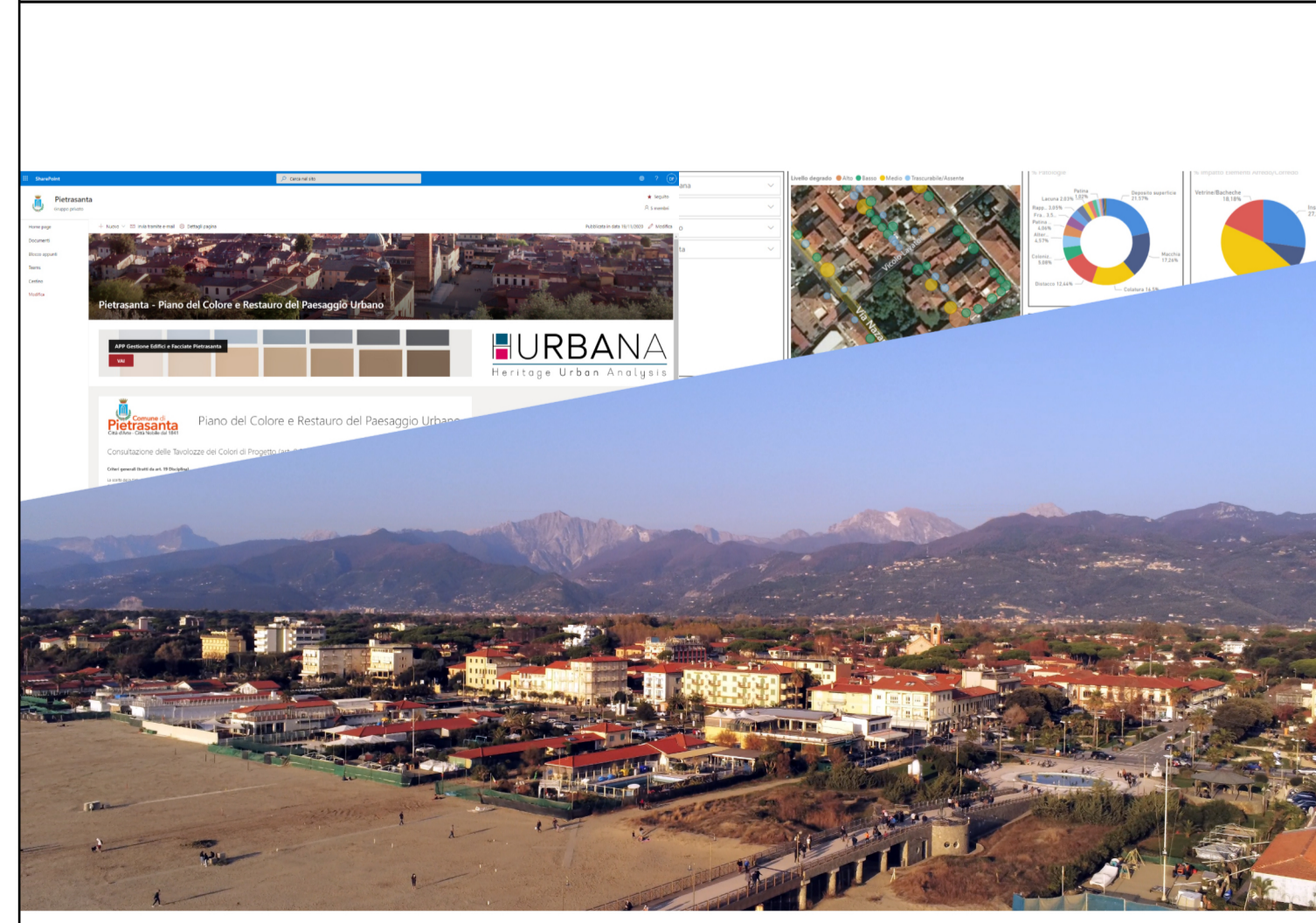
Piano del Colore e Restauro del Paesaggio Urbano

ELABORAZIONE Irene Centauro CONSULENTI David Fastelli - Giuseppe Alberto Centauro T01-P INDIVIDUAZIONE DELLE MACROAREE E CATEGORIE PARTICOLARI DI EDIFICI NOVEMBRE 2021