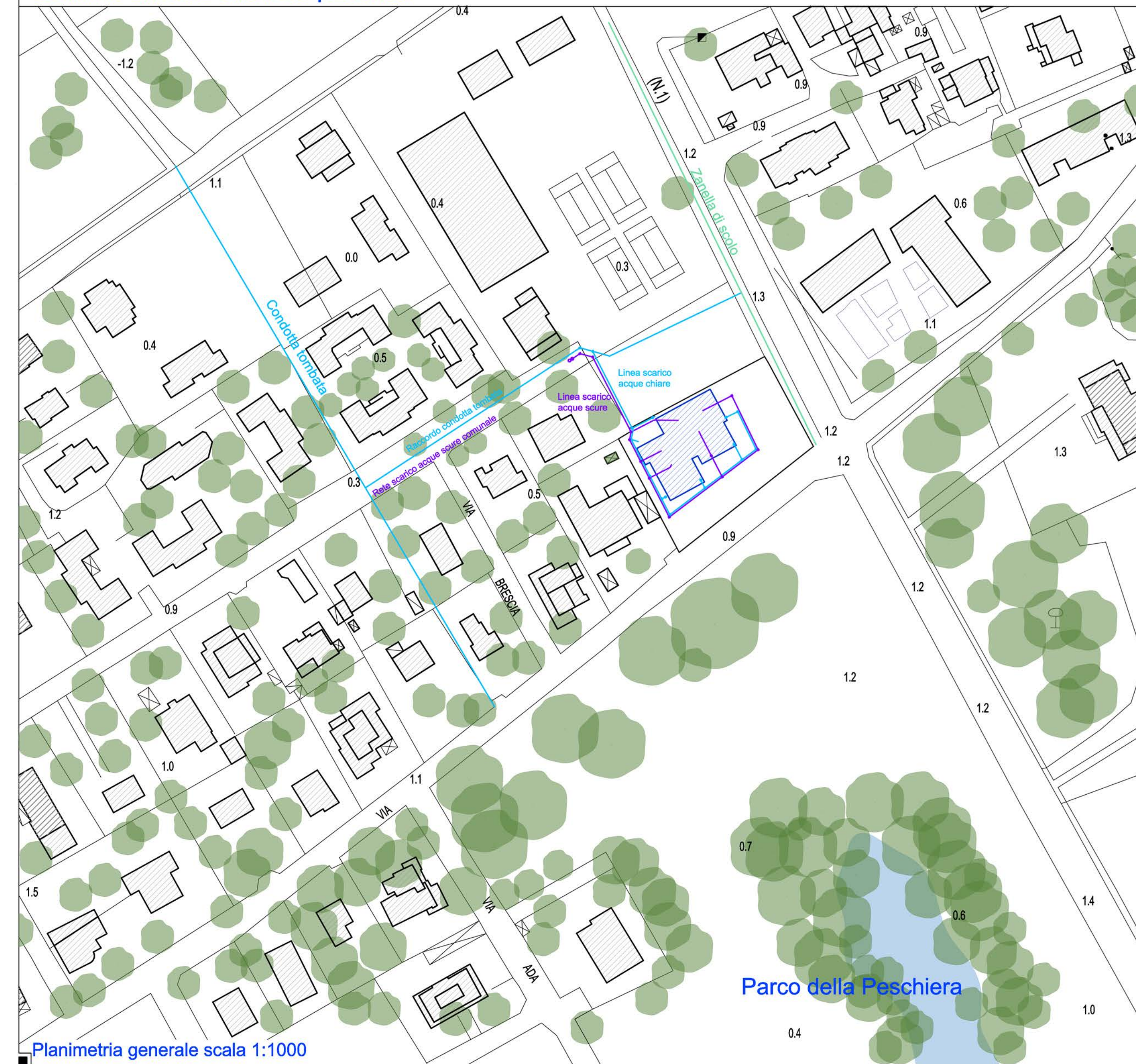
Planimetria generale scala 1:1000